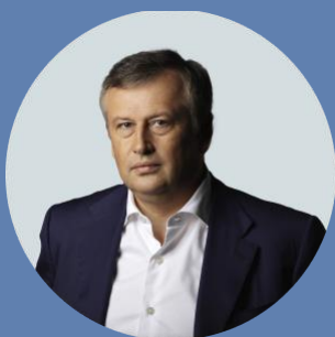
Губернатор Ленинградской области Александр Дрозденко

В этот праздничный день от души желаю благополучия, мира и счастья всем семьям Ленинградской области. Пусть в ваших домах всегда пребывают гармония и любовь!