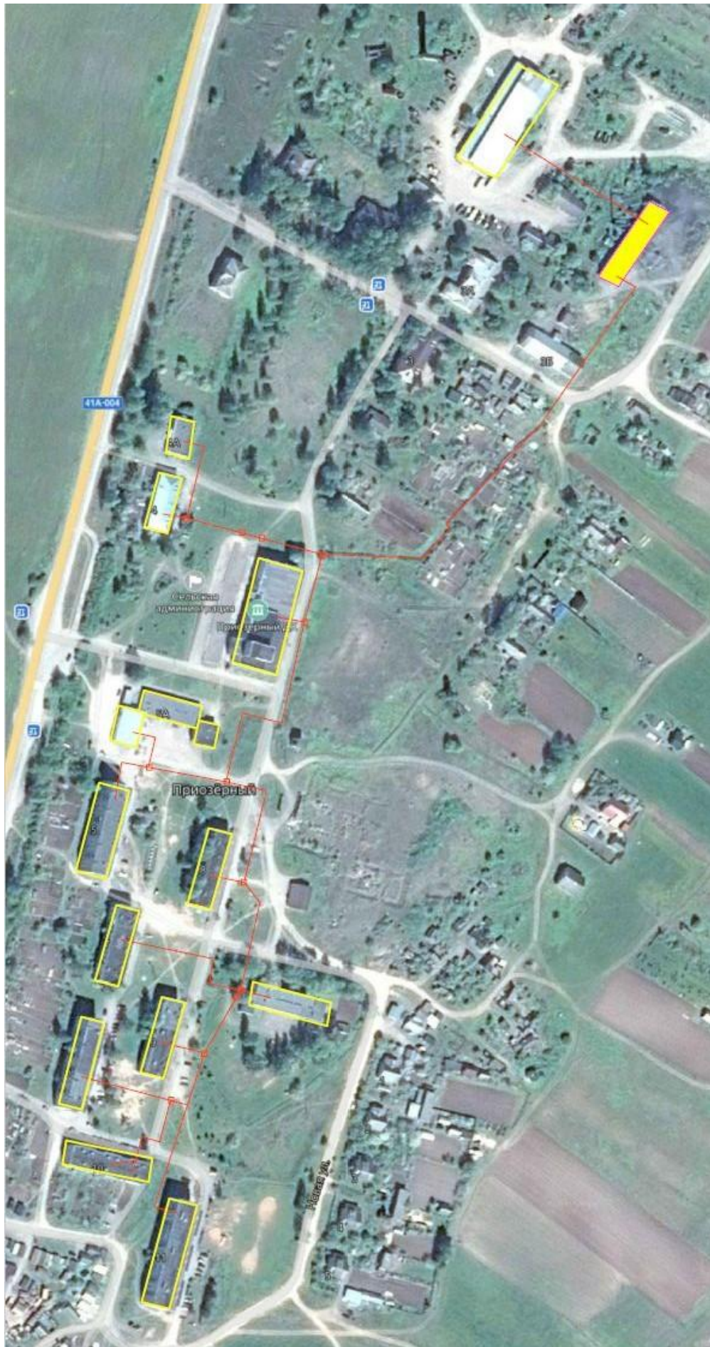
Рисунок 1.3.2 – Схема тепловых сетей котельной, п. Приозерный