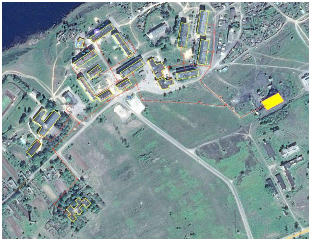
Рисунок 1.3.1 – Схема тепловых сетей котельной, д. Ям-Тёсово ООО «Интеерстрой»

Схема тепловых сетей централизованного теплоснабжения представлена на рисунке 1.3.1-1.3.2.